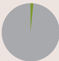
2. Taxonomie-Konformität der Investitionen ohne Staatsanleihen*

■ Taxonomiekonform (1 %) ■ Andere Investitionen (99 %)