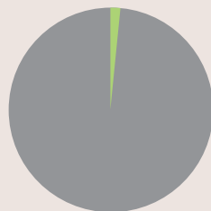
2. Taxonomie-Konformität der Investitionen ohne Staatsanleihen*

■ Taxonomiekonform (1 %) ■ Andere Investitionen (99 %)